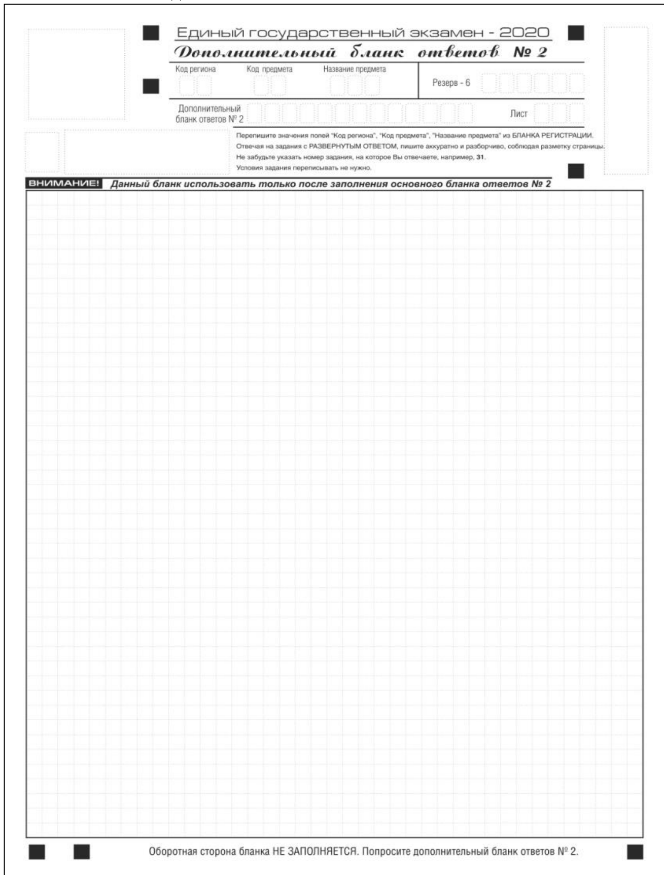
Рис. 15. Дополнительный бланк ответов №2

Дополнительный бланк ответов №2 выдается организатором в аудитории по требованию участника экзамена в случае недостаточного количества места для записи развернутых ответов.